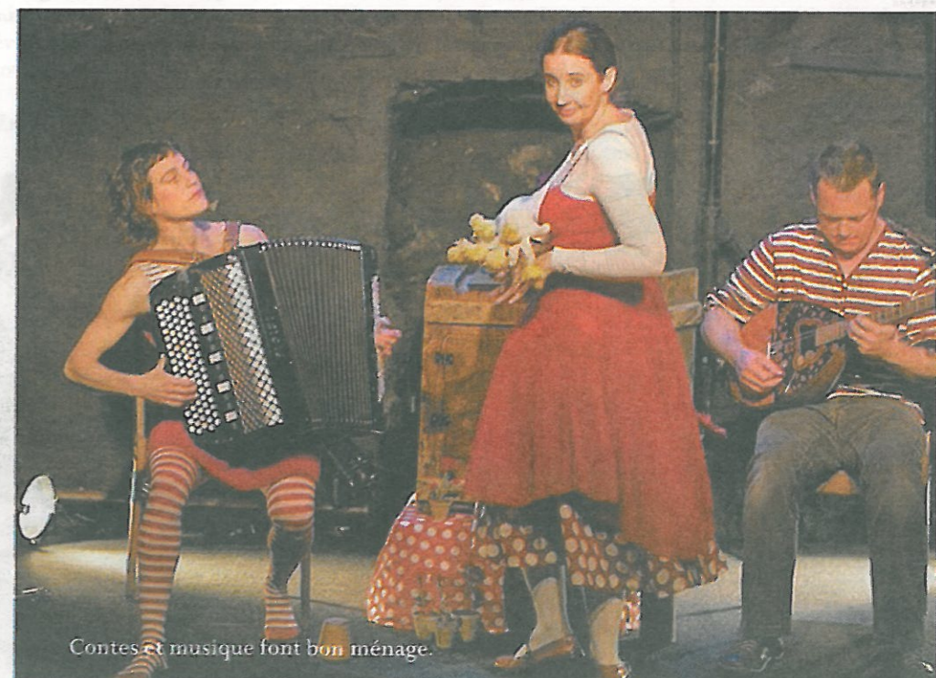
Contes et musique font bon ménage.