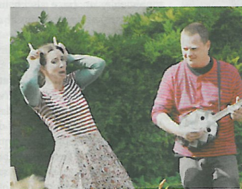
Notre coup de cœur: «La Pie qui Chante».