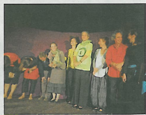
Que ces conteurs heureux soient remerciés!