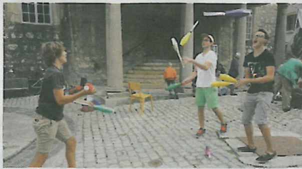
Jonglage à trois sur le Parvis.