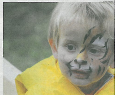
Un jeune spectateur fasciné.