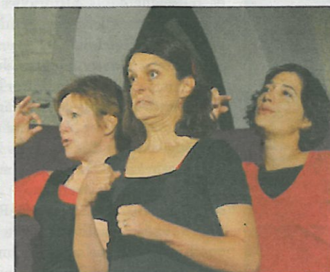
Un festival d'expressivité!