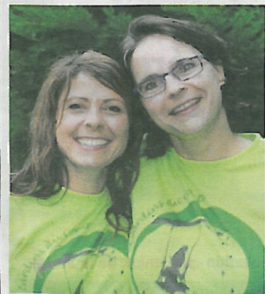
Les organisatrices n'en reviennent pas du succès obtenu.