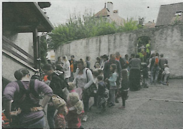
Obligation de faire la queue avec ce monde fou!